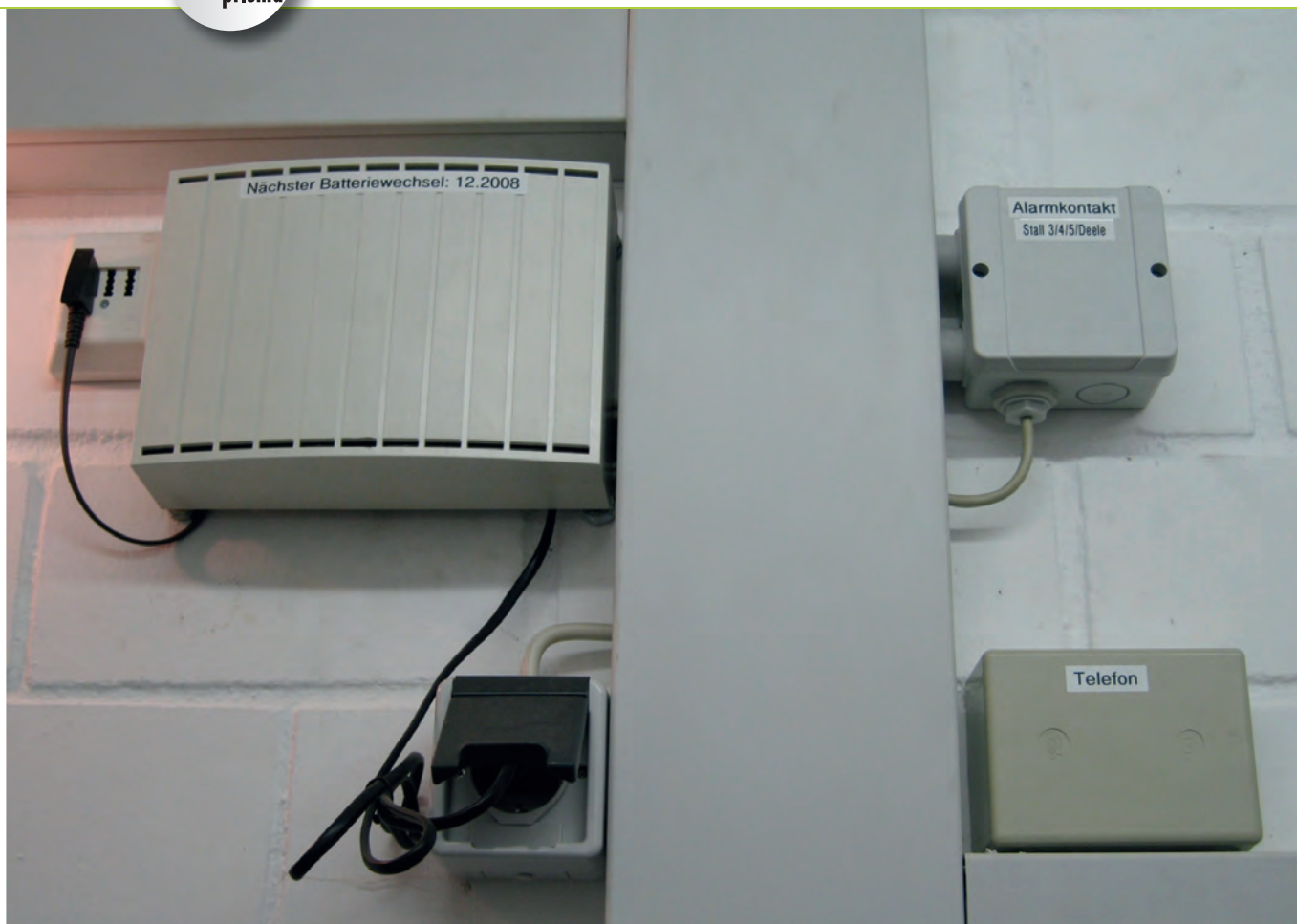
Bild 5 | Telefonwählgerät als Teil der Alarmierungskette, Quelle: Westfälische Provinzial Versicherung AG