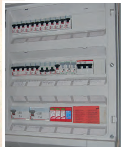
Bild 7 | Verteilung mit Überspannungsschutzgerät Typ 2, Quelle: Westfälische Provinzial Versicherung AG