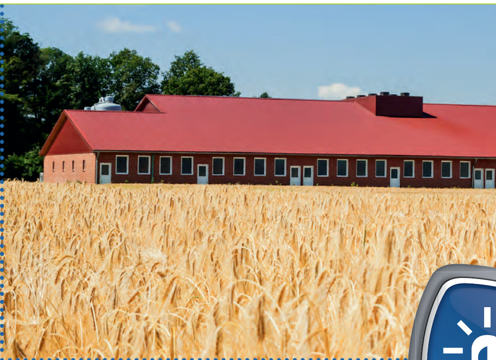
Bild 4 | Tote Schweine durch Lüftungsausfall