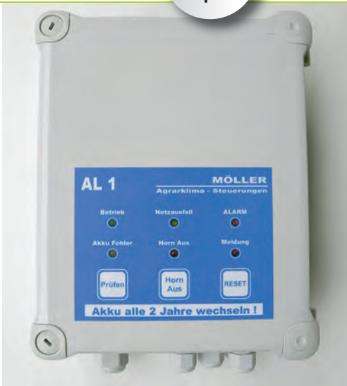
Bild 3 | Alarmanlage mit Anschluss für Alarmhorn, Blitzleuchte und Telefonwählgerät