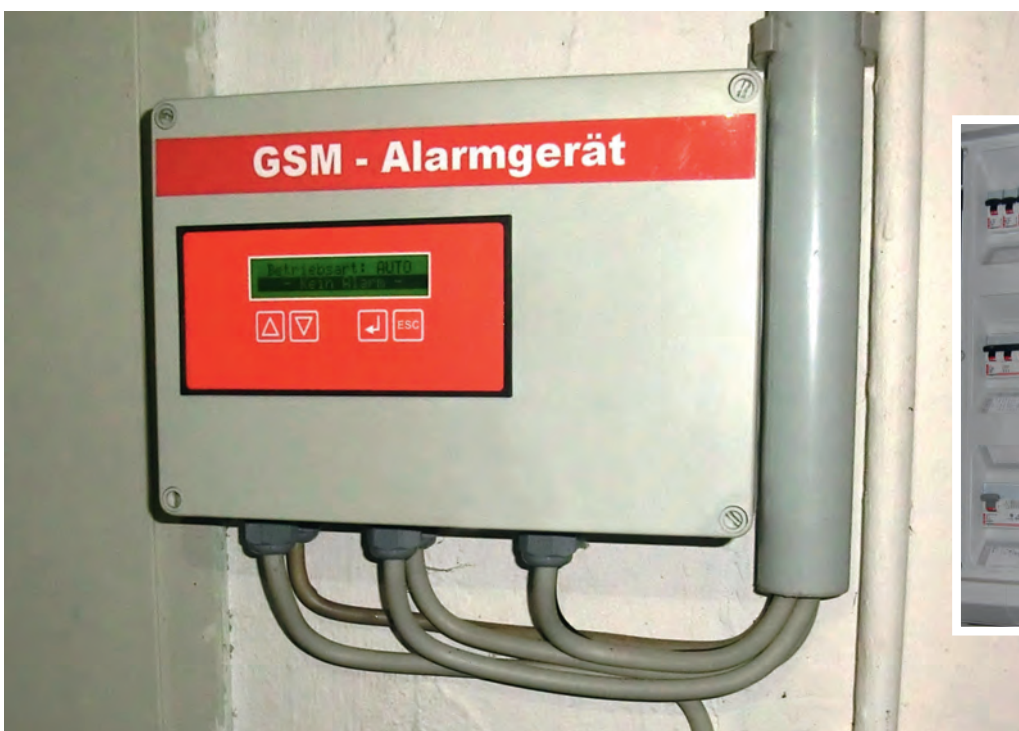
Bild 6 | Alarmgerät mit eingebauter telefonischer Weiterleitung über das Handynetz